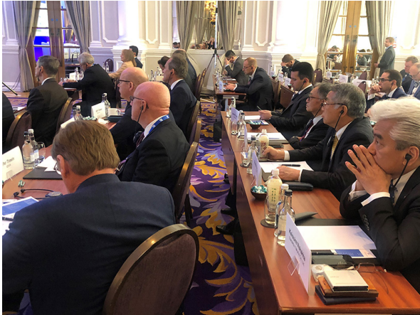
Asistentes a la Mesa Redonda de CEOs escuchan atentamente la presentación detallada sobre el mercado mayorista ruso